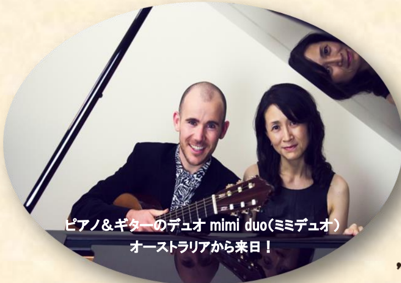
ピアノ&ギターデュオ mimi duo(ミミデュオ) オーストラリアから来日!